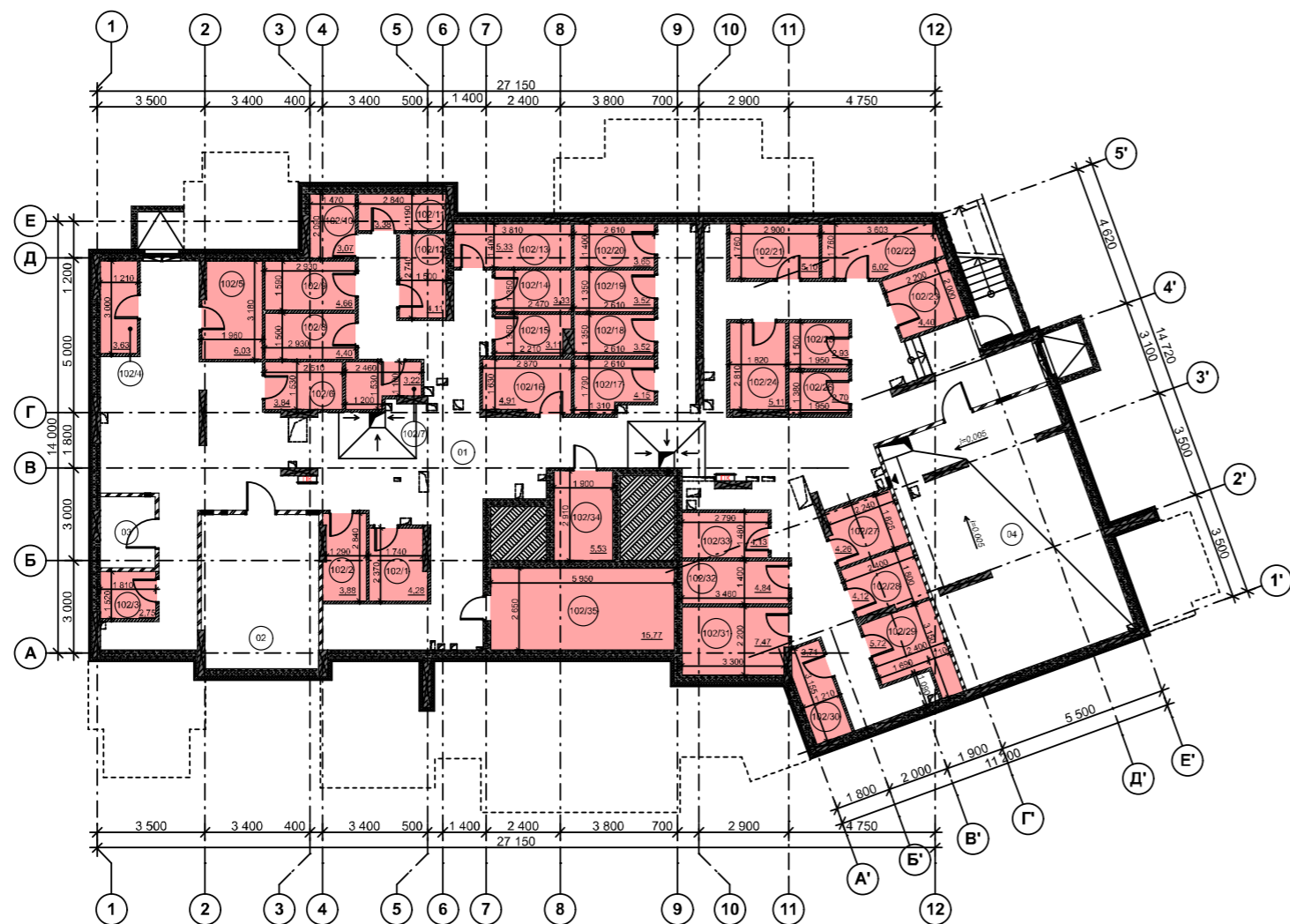
Схема розташування секцій